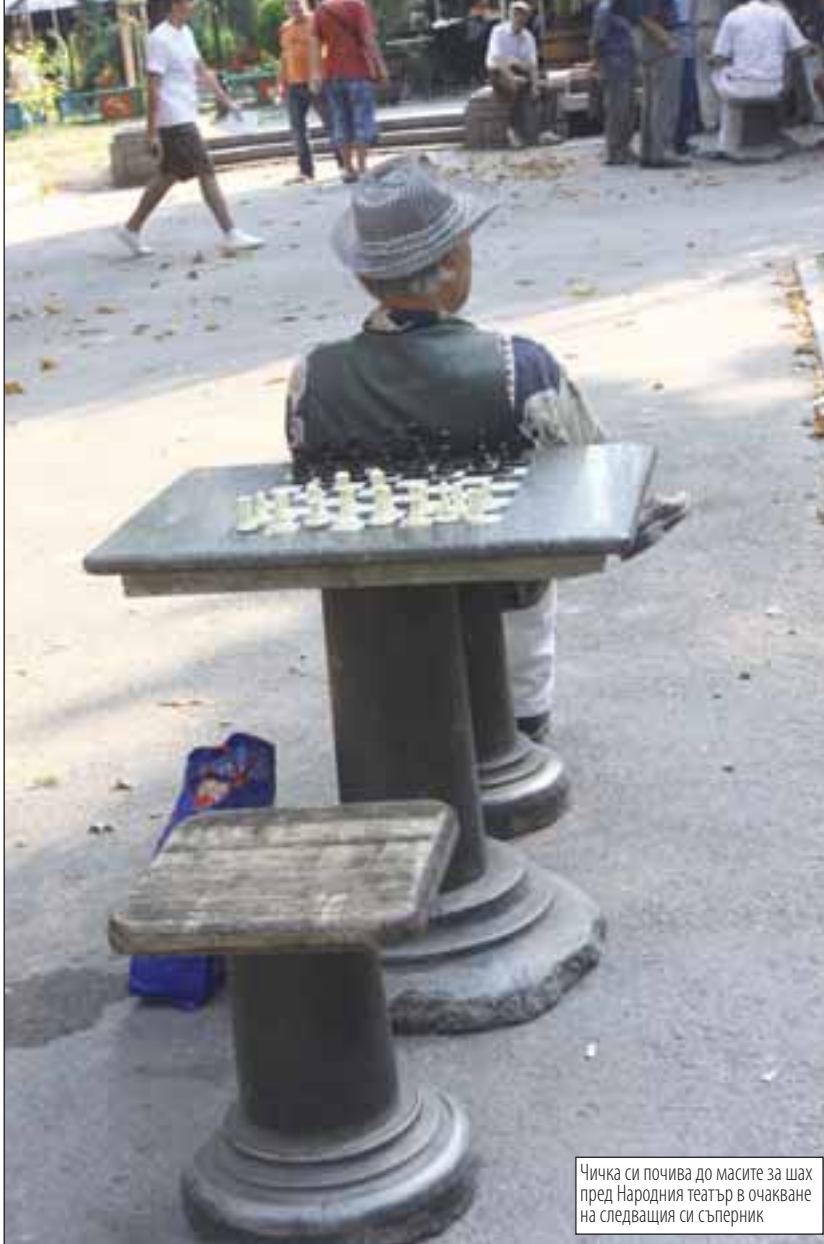
Чичка си почива до масите за шах пред Народния театър в очакване на следващия си съперник