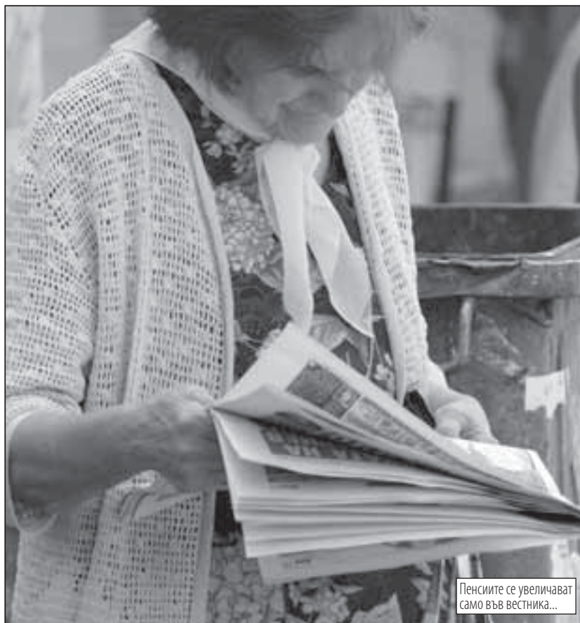
Пенсията се увеличават само във вестника...