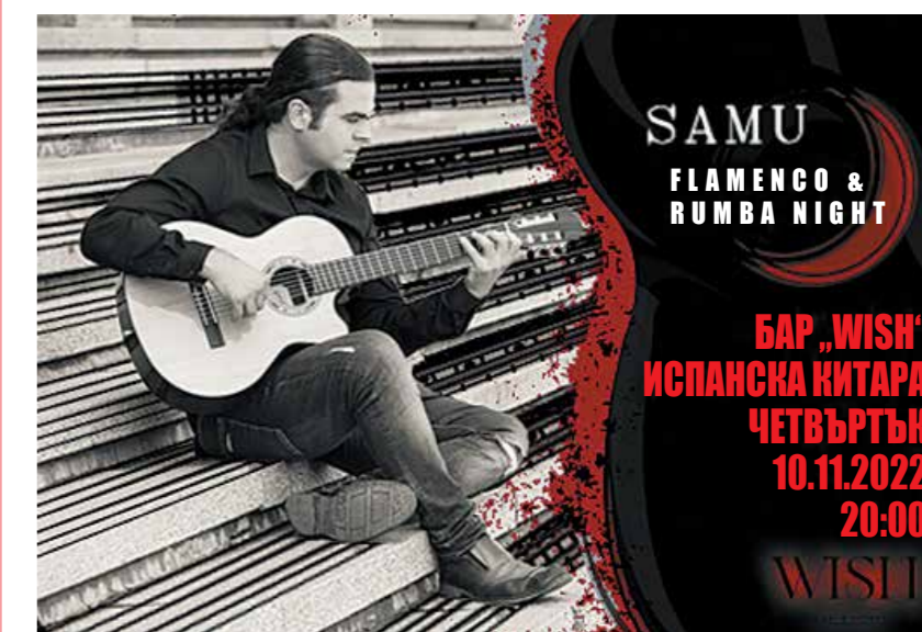
SAMU FLAMENCO & RUMBA NIGHT