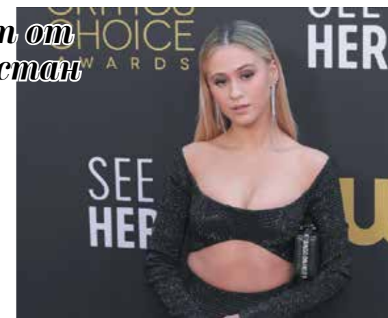
ИРИНА ШЕЙК И БРАДЛИ КУПЪР СЕ СЪБРАХА

продуцира за Нетфликс. Действието в него се развива през 1963 г. в Мичиган и разказва за заклетите съперници в производството на зърнени закуски Kellogg's и Post. В лентата ще участват куп звезди, сред тях Мелуса Маккарти, Ейми Шумър, Хю Грант и Крисчън Слейтър.