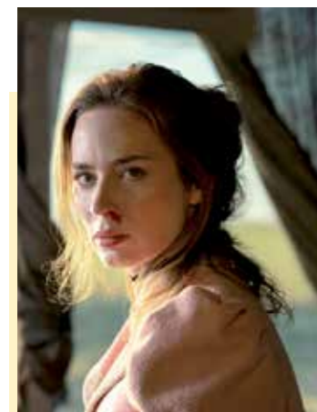
Емили Блънт и Часкей Спенсър са героите в уестърн сериала Англичанката, който дебютира в стрийминг плат-

Блънт) и Ели Уип (Часкей Спенсър), бивш разузнавач от кавалерията на Пауни, се пресичат през 1890 г. в Средния Запад на Америка. Всеки има своя цел и мотив да поеме на това пътешествие, чийто пейзаж е пропит от насилие, мечти и кръв. Тя се надява да открие човека, отговорен за смъртта на сина й, той иска да върне земята на предците си.