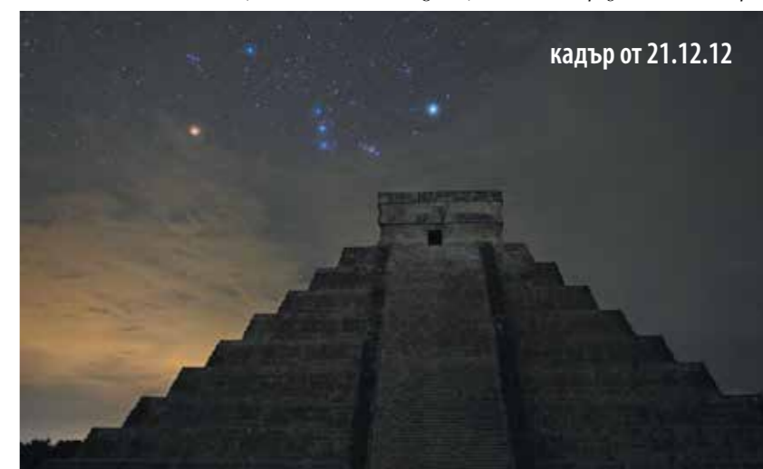
кадър от 21.12.12