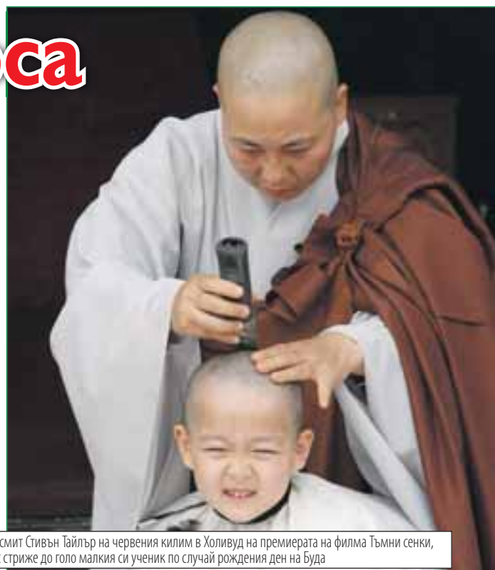
Американската актриса Клорис Лийчман си прави прическа с кичарата на легендата на Аеросмит Стивън Тайлър на червения килим в Холивуд на премиерата на филма Тъмни сенки, докато в същото време на другия край на света – в Джеджу (Южна Корея), възрастен монах стриже до голо малкия си ученик по случай рождения ден на Буда