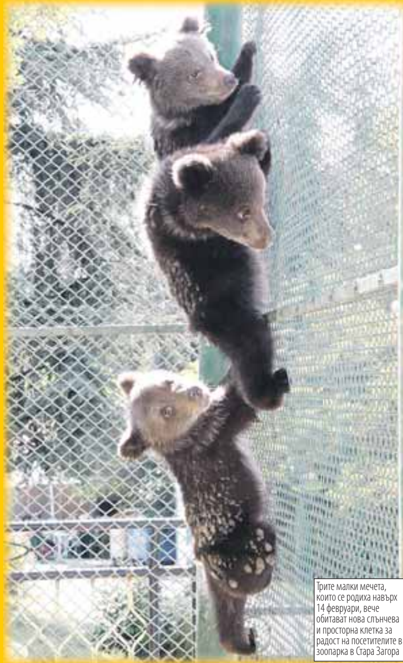
Трите малки мечета, които се родиха навърх 14 февруари, вече обитават нова слънчева и просторна клетка за радост на посетителите в зоопарка в Стара Загора