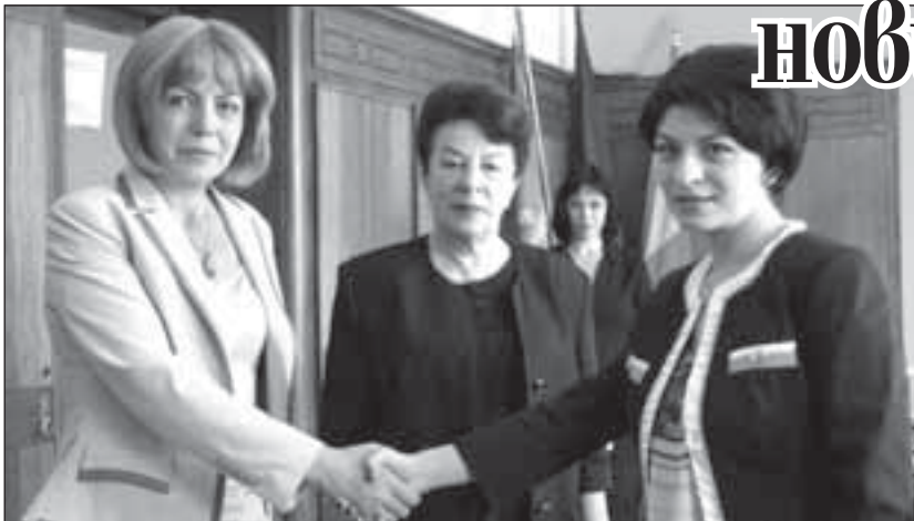
Кметът на София Йорданка Фандъкова се среща с министъра на здравеопазването Десислава Атанасова по повод обсъждането на възможността за предоставянето на помещения за кабинети на спешната медицинска помощ в общинските диагностично-консултативни центрове