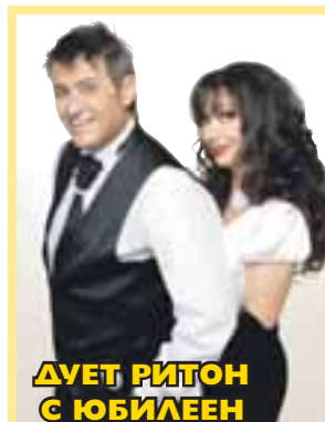
ДУЕТ РИТОН С ЮБИЛЕЕН КОНЦЕРТ

тисти тя определя Йордан Йовчев и Христо Стоичков. Спортното събитие, на което мечтае да присъства, поне веднъж в живота си, е волейболен мач за финала на световно първенство с участието на българския отбор.