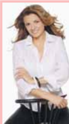
рители на всички важни мачове..

Тържествената церемония за връчването на титлите ще се излъчи по БНТ през юни. Момичетата, избрани за талисмани, ще придружават отбо-