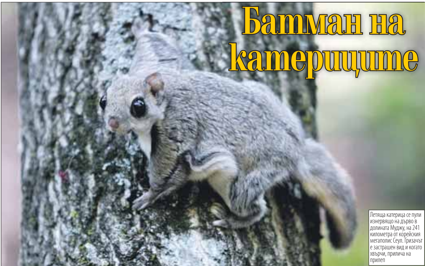
Летяща катерица се пули изнервящо на дърво в долината Муджу, на 241 километра от корейския мегаполис Сеул. Гризачът е застрашен вид и когато хвърчи, прилича на прилеп