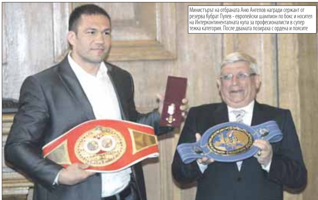
Министърът на отбраната Аню Ангелов награди сержант от резерва Кубрат Пулев - европейски шампион по бокс и носител на Интерконтиненталната купа за професионалисти в супер тежка категория. После двамата позираха с ордена и поясите

„Мачът беше най-тежкият в кариерата ми. Отстрани не