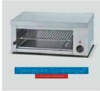
Принцесник тип Саламандър - 225 Размери: 56x30x26см, до 300 градуса 830

- КАК ПРЕКРЪСТИЛИ ЛЕВОН ХАМПАРЦУМЯН? - ЕВРОН ХАМПАРЦУМЯН!