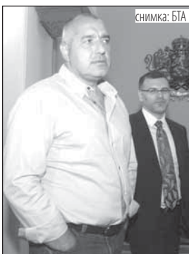
Премиерът Бойко Борисов, вицепремиерът Симеон Дянков, министърът на земеделието и храните Мирослав Найденов и министърът на регионалното развитие и благоустройството Лилияна Павлова дадоха брифинг в Министерски съвет. На брифинга бе съобщено, че министърът на финансите е избран за председател на Надзорния съвет на Европейската банка за възстановяване и развитие (ЕВБР)

„Датата за присъединяване на България към еврозоната изобщо не е предмет на обсъждане, защото не е ясно ще има ли допълнителни правила и институции“, изтъкна