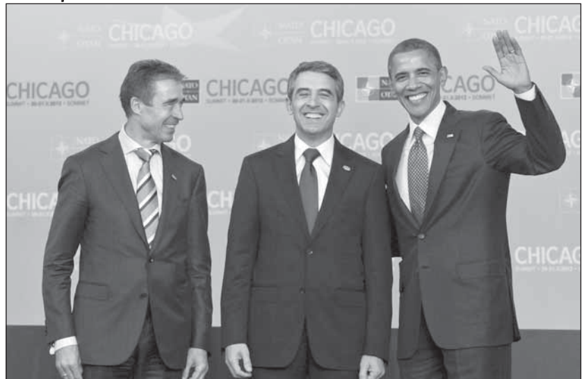
Американският президент Барак Обама и генералният секретар на НАТО Андрес Расмусен посрещнаха българския държавен глава Росен Плевнелиев в Чикаго, Илинойс. Световните лидери участваха в двудневно събитие, за да обсъдят международната сигурност и въпросите, свързани с Афганистан