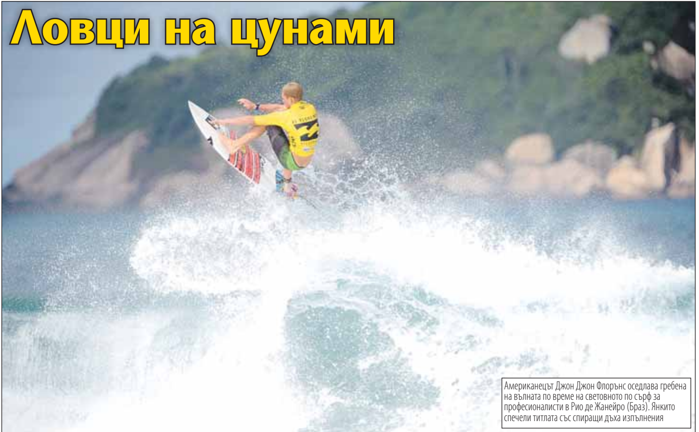
Американецът Джон Джон Флорънс оседлава гребена на вълната по време на световното по сърф за професионалисти в Рио де Жанейро (Браз). Янкито спечели титлата със спиращи дъха изпълнения