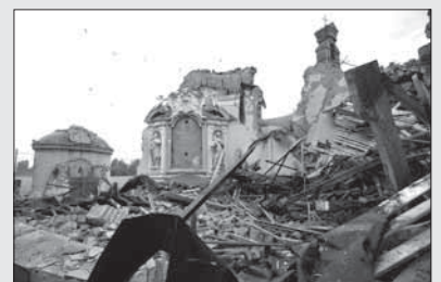
Броят на загиналите земетресението, което удари северната част на Италия в ранните часове в неделя, се увеличи на 7 души. След природното бедствие десетки сгради с историческа стойност бяха разрушени

Поредица от 100 вторични трусове бяха регистрирани рано сутринта в северната италианска област Емилия-Романя след разрушителното земетресение с магнитуд 5,9 по скалата на Рихтер в неделя, което по последни данни е причинило смъртта на 7 души. Около 3000 души прекараха нощта в палатки, спортни зали или при близки. Някои хора спаха в колите си поради опасения от нови вторични трусове. Последното силно земетресение в