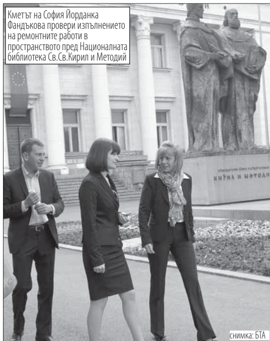
Кметът на София Йорданка Фандъкова провери изпълнението на ремонтните работи в пространството пред Националната библиотека Св.Св.Кирил и Методий

От 10 до 50 лева е глобата, ако някой посегне да откъсне цветя от общинска леха