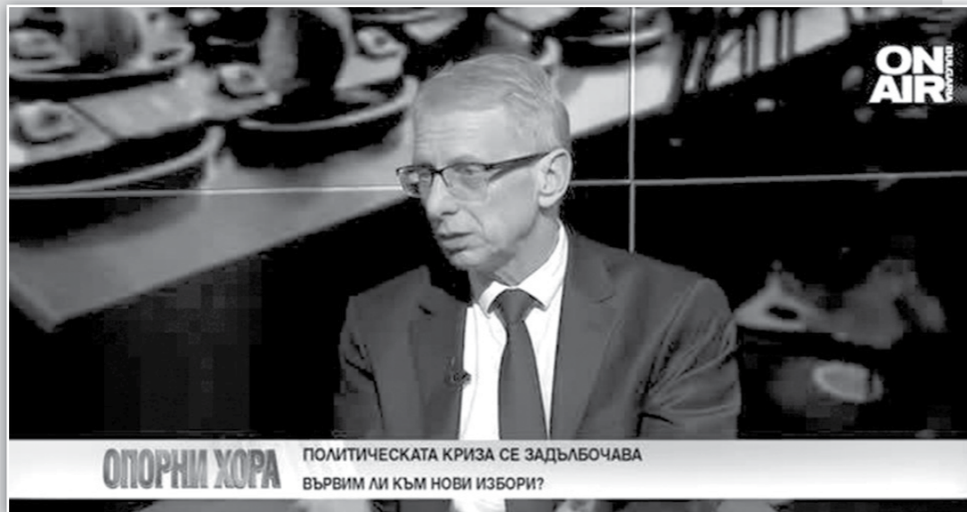
ОПОРНИ ХОРА ПОЛИТИЧЕСКАТА КРИЗА СЕ ЗАДЪЛБОЧАВА ВЪРВИМ ЛИ КЪМ НОВИ ИЗБОРИ?

От казаното от Денков следва, че ПП е готова да загуби, за да спечели Възраждане. Апропо, и сега Продължаваме промяната и партията на Костадинов са на практика изравнени – депутатите на Денков и Петков, които имат обща нищо неправедна, но щедро финансирана неправителствена организа-