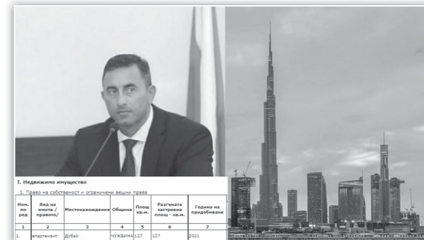
1. Недвижимо имущество