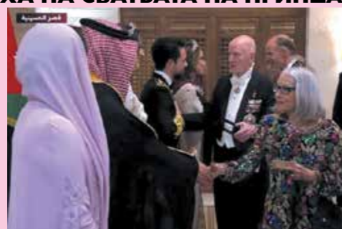
Цар Симеон е бил близък приятел с покойния крал Хюсеин, бащата на крал Абдула II от годините, прекарани в колежа в Александрия.

Цар Симеон Саксбургготски и царица Маргарита Гомес-Асебо и Сехуела Саксбургготска бяха гости на сватбата на принца на Йордания Хюсеин и Раджуа ал Саиф. Те присъстваха на сватбената церемония, която се състоя в двореца Захран в Аман, същото място, което са избрали за своите венчавки бащата на Крал Абдула II и Кралица Рания, а преди тях и покойният крал Хюсеин, съобщават от официалния уебсайт на Симеон Саксбургготски. Приятелските отношения между българското царско семейство и йорданското кралско семейство датират от много години.