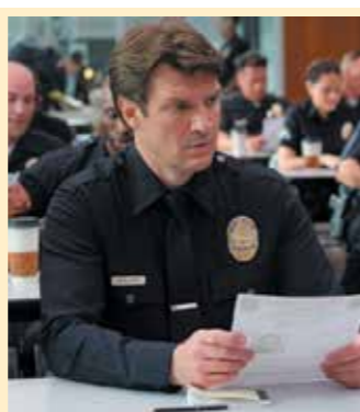
от екшън поредицата всяка сряда, четвъртък и петък.

неутоим чар за първи път след Касъл. Този път Нейтън Филиън ще се превъплъти в авантюриста Джон Нолан, чийто живот се променя напълно след съдбовния му избор да стане полицай. Това го изправя пред редица опасни предизвикателства, но с решителността си и чувството си за хумор героят постига вдъхновяващ успех. Зрителите могат да проследят епизодите