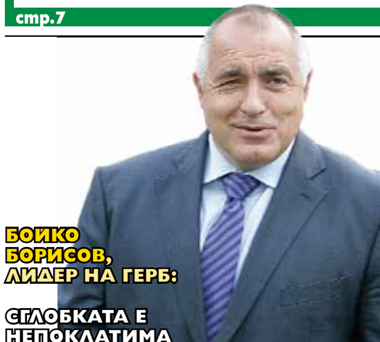
БОИКО БОРИСОВ, ЛИДЕР НА ГЕРБ: