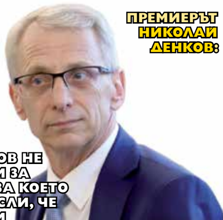
ПРЕМИЕРЪТ НИКОЛАЙ ДЕНКОВ:

БОРИСОВ НЕ ГОВОРИ ЗА ТОВА, ЗА КОЕТО СИ МИСЛИ, ЧЕ ГОВОРИ