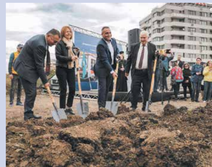
ЗАТВАРЯНЕ НА БУЛ. ПАНЧО ВЛАДИГЕРОВ, УЛ. ОБЕЛСКО ШОСЕ И КВАРТАЛНИ УЛИЦИ В ОБЕЛЯ 1', СЪОБЩИ КМЕ-ТЪТ ФАНДЪКОВА.

СПИРКАТА В ОБЕЛЯ ЩЕ СЛУЖИ ЗА ПРЕКАЧВАНЕ МЕЖДУ ЛИНИЯ 1 И ЛИНИЯ 2 НА МЕТРОТО. ОСВЕН НОВА СТАНЦИЯ ИЗГРАЖДАМЕ И 900 М ТУНЕЛ ЗА ВРЪЗКА С ДЕПО ОБЕЛЯ. ПО ВРЕМЕ НА СТРОИТЕЛСТВОТО НЕ СЕ ПРЕДВИЖДА