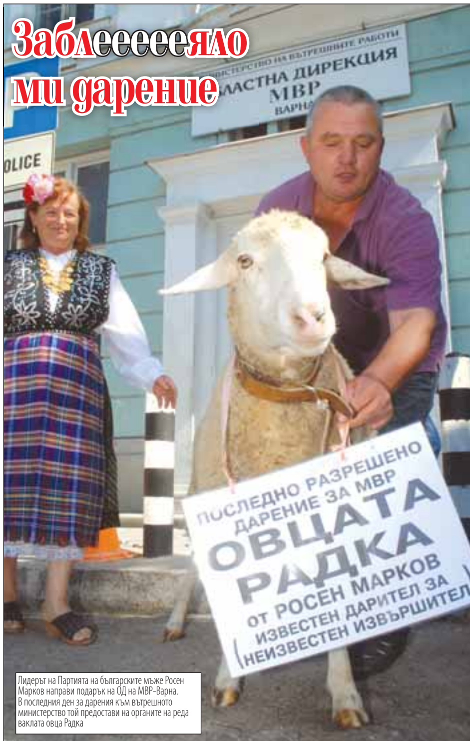
Лидерът на Партията на българските мъже Росен Марков направи подарък на ОД на МВР-Варна. В последния ден за дарения към вътрешното министерство той предостави на органите на реда ваклата овца Радка