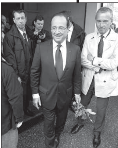
Франският президент Франсоа Оланд след гласуването за първия кръг от френските парламентарните избори в избирателната секция в Тюл

Вторият тур ще се проведе на 17 юни. Кандидатите са длъжни да съберат най-малко 12,5% от гласовете на французите, за да участват в неделя.