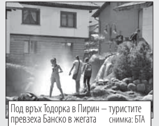
Под връх Тодорка в Пирин – туристите превзеха Банско в жегата

Температурни рекорди в планините отчетоха вчера. На връх Мусала температурата достигна 13,4 градуса, на връх Ботев са отчетени 16,4 градуса, на връх Мургаш температурата е била 23,2 градуса. На Черни връх измерената температура вчера бе 18,2 градуса. На връх Рожан в Родопите пък е измерена температура от 25,3 градуса.