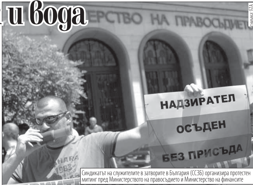
Синдикатът на служителите в затворите в България (ССЗБ) организира протестен митинг пред Министерството на правосъдието и Министерството на финансите

Главното искане на протестиращите е осигуряване на финансиране за нормално извършване на работата в затворите за 2012 г. Сред недоволните имаше служители от София, Варна, Пловдив, Бургас, Враца, Стара Загора, Па-