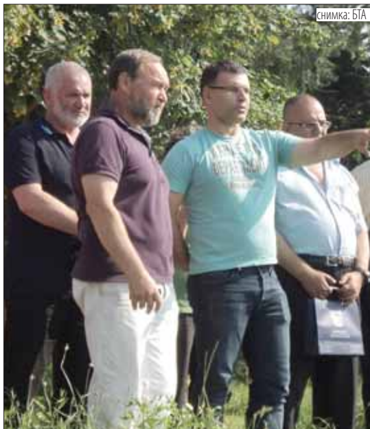
Министърът на финансите Симеон Дянков пристигна на двудневно неофициално посещение в Силистра. Той бе придружен от директора на Националния исторически музей проф. Божидар Димитров. С местните ръководители бяха обсъдени проекти за реставрация и възстановка на културни и исторически обекти и за развитието на туризма

„За финансово най-неефективните общини ще бъде предвиден автоматичен механизъм, чрез който те да не могат да кандидатстват за допълнителни средства от държавния бюджет за капита-