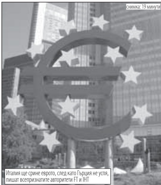
Италия ще срине еврото, след като Гърция не успя, пишат всепризнатите авторитети FT и ИИТ

На 4-о място е собственикът на най-големия трезор у нас Уникредит с 6,7 на сто – малко над психологическата граница от 6%. Според информацията на агенция Блумбърг