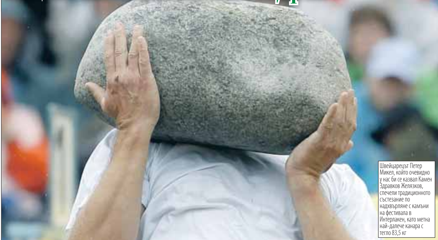
Швейцарецът Петер Микел, който очевидно у нас би се казвал Камен Здравков Желязков, спечели традиционното състезание по надхвърляне с камъни на фестивала в Интерлакен, като метна най-далече канара с тегло 83,5 кг