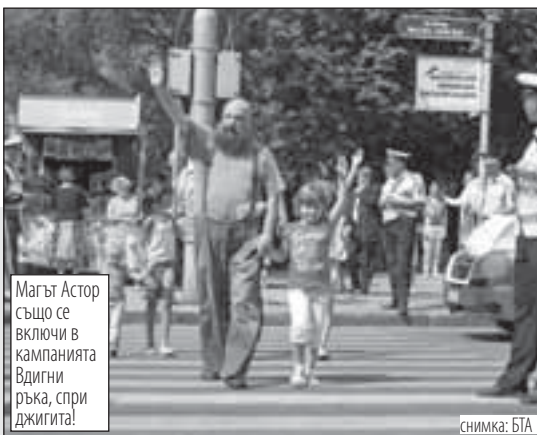
Магът Астор също се включи в кампанията Вдигни ръка, спри джигита!

в цената за естествено и оперативно раждане – 900 лв. е изборът на екип при физиологично раждане, а 1400 лв. е цената на избор на екип при цезарово сечение по желание. В МБАЛ Света София физиологичното раждане е 1200 лв., а раждането чрез цезарово сечение е 1400 лв.