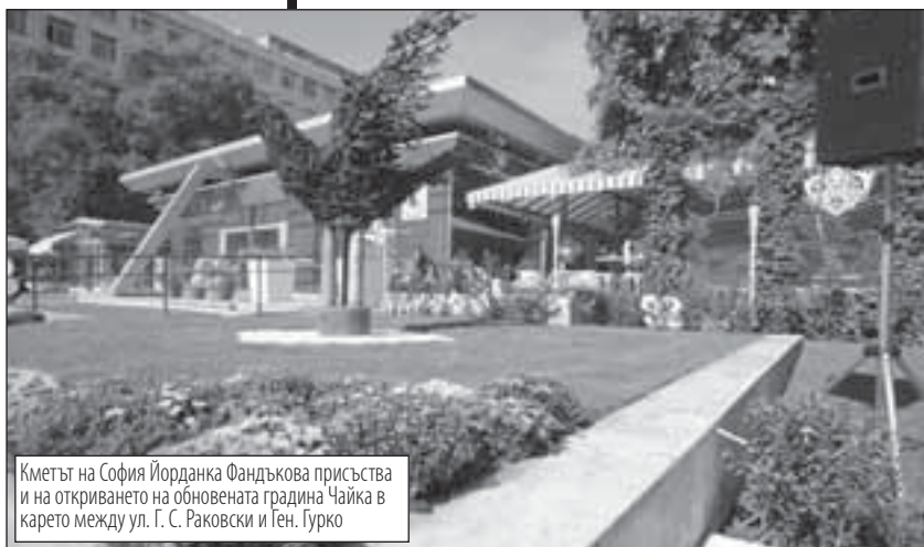
Кметът на София Йорданка Фандъкова присъства и на откриването на обновената градина Чайка в карето между ул. Г. С. Раковски и Ген. Гурко

Мостовите съоръжения на Сточна гара също ще бъдат ремонтирани. Предстои възстановяване на четири моста на надлез Надежда.