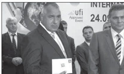
Министър – председателят Бойко Борисов откри Международния технически панаир в Пловдив. Премиерът валидира нова пощенска марка посветена на 120-та годишнина от Първото българско изложение

При първа възможност ще бъдат увеличени заплатите на полицаите, но не сега. Това заяви премиерът Бойко Борисов. Той