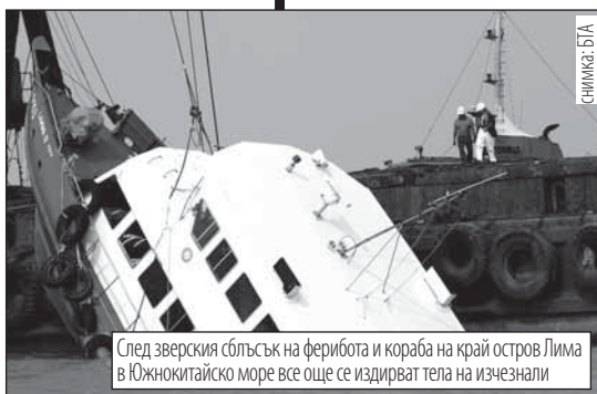
След зверския сблъсък на ферибота и кораба на край остров Лима в Южнокитайско море все още се издирват тела на изчезнали

сериозно или критично. Корабът е превозвал 121 пътници и 3-ма души екипаж. Другият плавателен съд, пътнически ферибот, е успял да достигне до остров Лама, въпреки че предната му част е пострадала тежко при сблъсък. Няколко души сред пътниците и екипажа са били откарани в болница с наранявания. Не е ясна причината за инцидента, властите са предприели разследване.