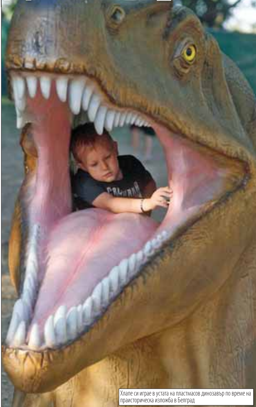
Хлапе си играе в устата на пластмасов динозавър по време на праисторическа изложба в Белград