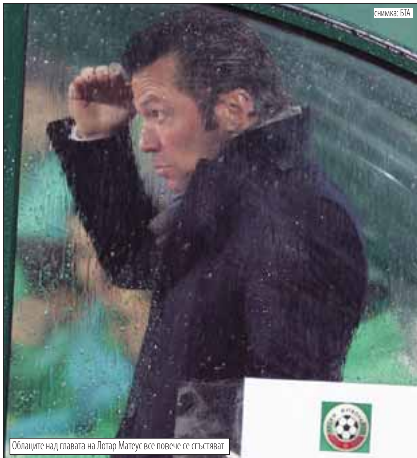
Облаците над главата на Лотар Матеус все повече се съгъхват

Другият вариант за селекционер е Красимир Балъков, който в момента води хърватската Хайдук. По наши сведения Боби Михайлов е бил в събота в Сплит, за да гледа на живо местното супердерби с Динамо