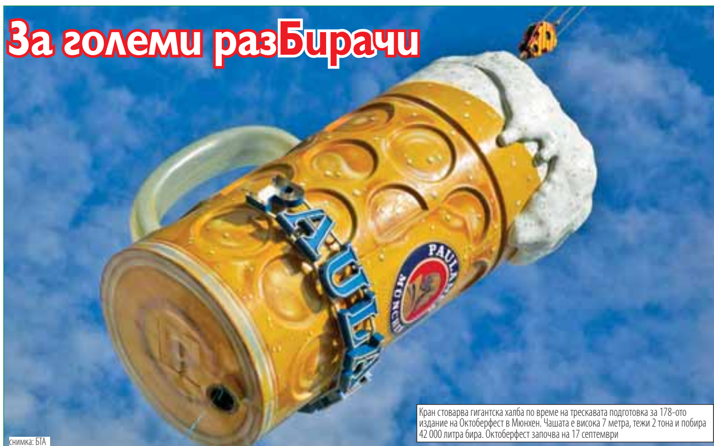
Кран стоварва гигантска халба по време на трескавата подготовка за 178-ото издание на Октоберфест в Мюнхен. Чашата е висока 7 метра, тежи 2 тона и побира 42 000 литра бира. Октоберфест започва на 17 септември