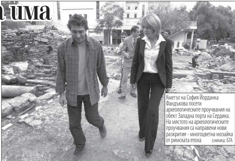
Кметът на София Йорданка Фандъкова посети археологическите проучвания на обект Западна порта на Сердика. На мястото на археологическите проучвания са направени нови разкрития - многоцветна мозайка от римската епоха