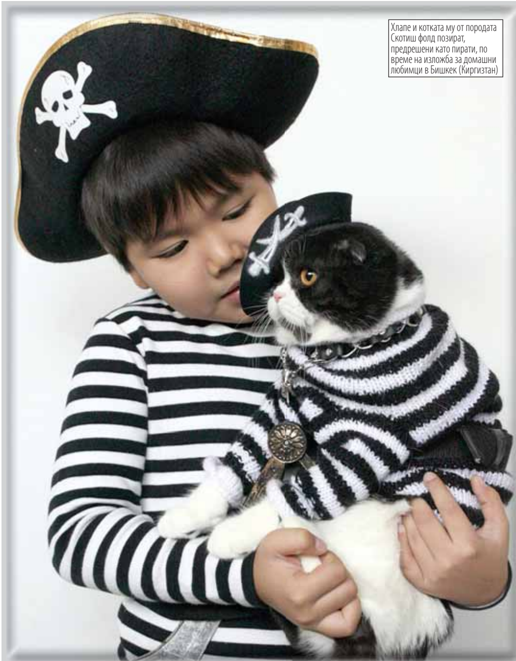
Хлапе и котката му от породата Скотиш фолд позират, предрешени като пирати, по време на изложба за домашни любимци в Бишкек (Киргизтан)