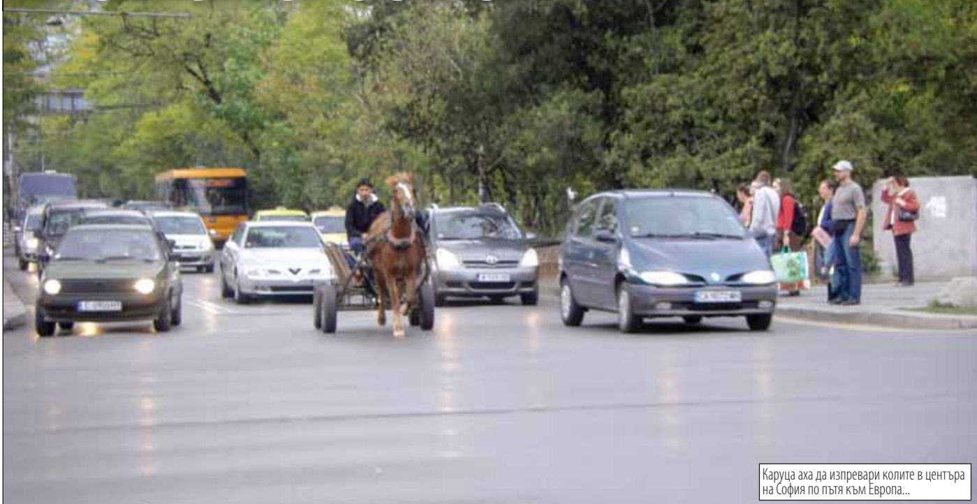
Каруца аха да изпревари колите в центъра на София по пътя към Европа...