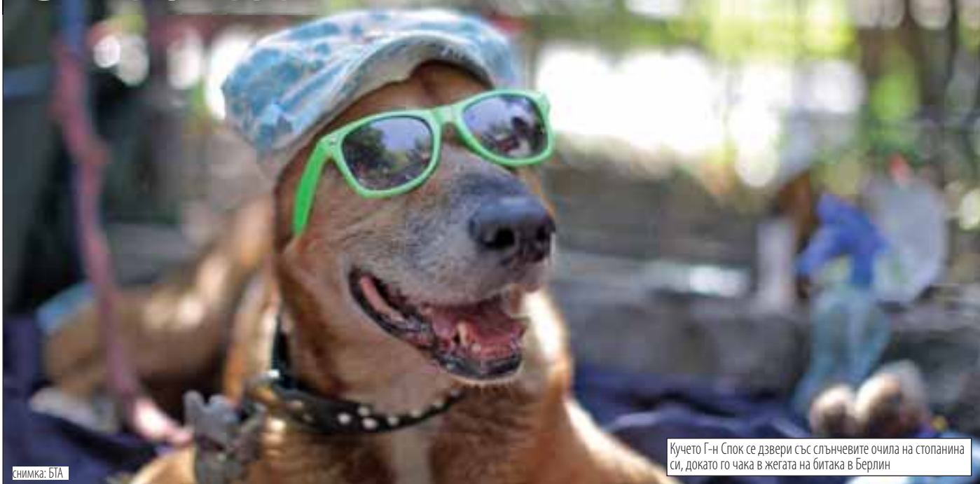
Кучето Г-н Спок се дзвери със слънчевите очила на стопанина си, докато го чака в жегата на битаката в Берлин