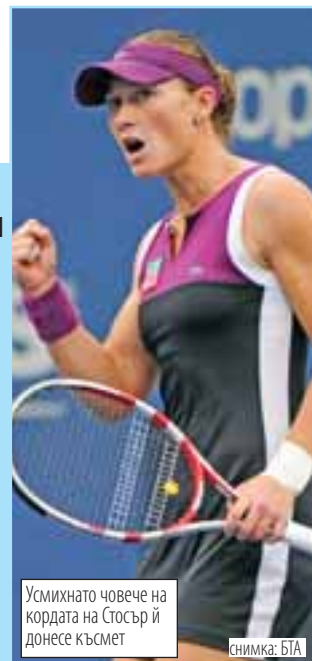
Усмивнато човече на кордата на Стосър й донесе късмет

през 1980 година. За 29-годишната Серина Уилямс пък това бе едва втори турнир от Големия шлем след сериозните здравословни проблеми, които я извадиха от активния спорт за година. Тя пропусна възможността да завоюва четвъртия си трофей от Откритото първенство на САЩ. Последната титла от Шлема на Серина бе от Уимбълдън през миналата година. Още в началните минути на мача Стосър имаше преимущество пред съперничката си. Австралийката реализира ранен пробив в третия гейм, след което трябва да спасява подаването си. До края на сета