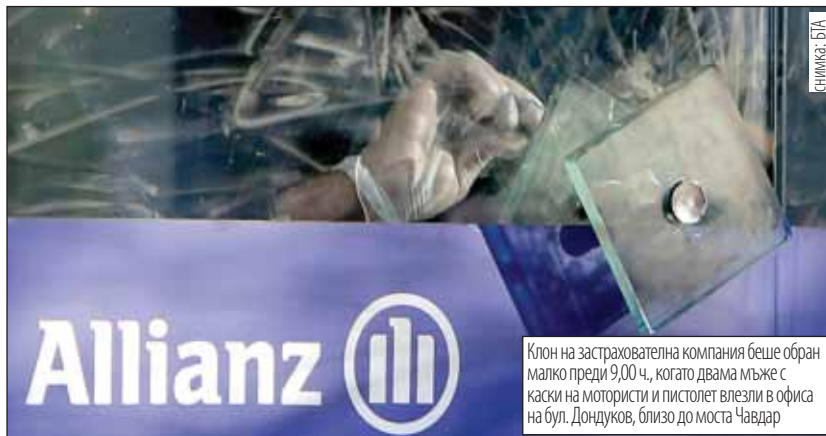
Клон на застрахователна компания беше обран малко преди 9,00 ч., когато двама мъже с каски на мотористи и пистолет влезли в офиса на бул. Дондуков, близо до моста Чавдар

Клонът на Алианц се намира в центъра на София на булевард Княз Александър Донду-