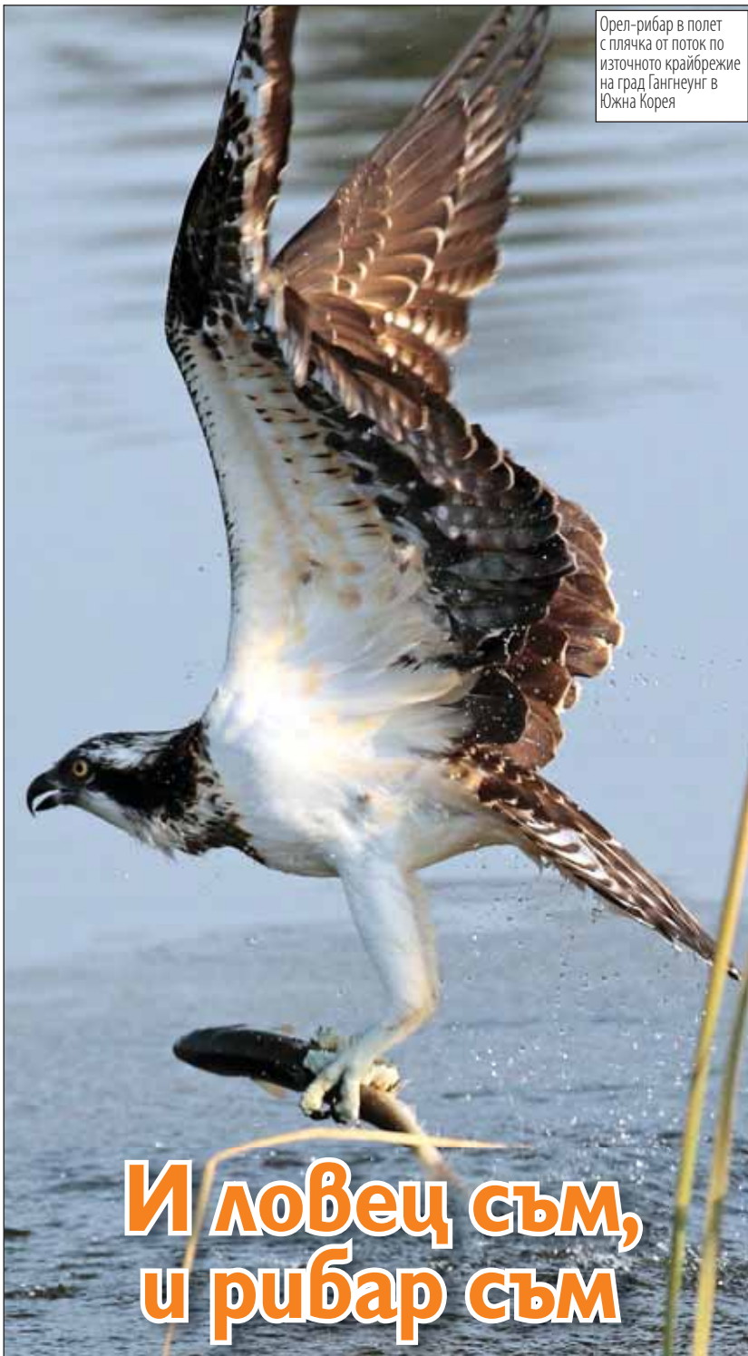
Орел-рибар в полет с плячка от поток по източното крайбрежие на град Гангнеунг в Южна Корея