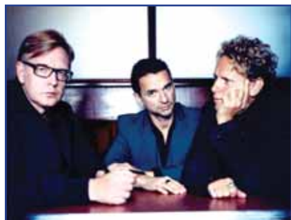
ДЕРЕШЕ МОДЕ СЕ ЗАВРЪЩАТ В БЪЛГАРИЯ

Групата Dereche Mode, кръстена на едноименното френско модно списание, ще стъпи на българска земя за второ грандиозно шоу в средата на следващата година. По неофициални данни концертът е планиран за 12 май 2013 г. Този път Дейв Геън, Мартин Гор и