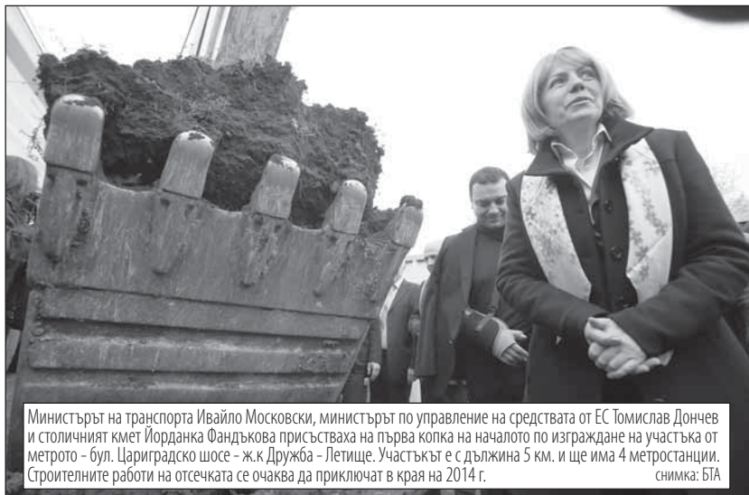
Министърът на транспорта Ивайло Московски, министърът по управление на средствата от ЕС Томислав Дончев и столичният кмет Йорданка Фандъкова присъстваха на първа копка на началото по изграждане на участъка от метрото - бул. Цариградско шосе - ж.к. Дружба - Летище. Участъкът е с дължина 5 км. и ще има 4 метростанции. Строителните работи на отсечката се очаква да приключат в края на 2014 г.