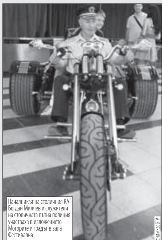
Началникът на столичния КАТ Богдан Милчев и служители на столичната пътна полиция участваха в изложението "Моторите и градът" в зала Фестивална