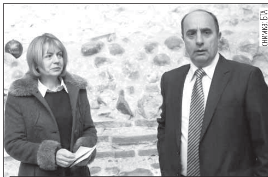
Кметът на София Йорданка Фандъкова присъства на представянето на Виртуален музей Сердика - Средец - София в Сердикийския амфитеатър в хотел Арена ди Сердика. Виртуалният музей е проект на Рекламно-информационна агенция Златен змей, съфинансиран от Програма Култура на Столична община през 2012 г., в подкрепа на кандидатурата на София за Европейска столица на културата и е инсталиран на сайта www.sofiamuseum.bg .

За посетители ще бъде отворен подземният археологически музей под базиликата Св. София, посочи Фандъкова. "Изпратила съм писмо до г-н Рашидов да го предостави за управление на общината. Едновременно с това до края на следващата година трябва да приключи и довършването на музея за история на Со-