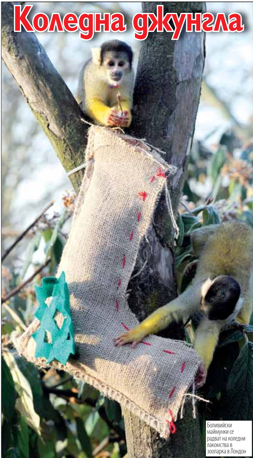
Боливийски маймуни се радват на коледни лакомства в зоопарка в Лондон