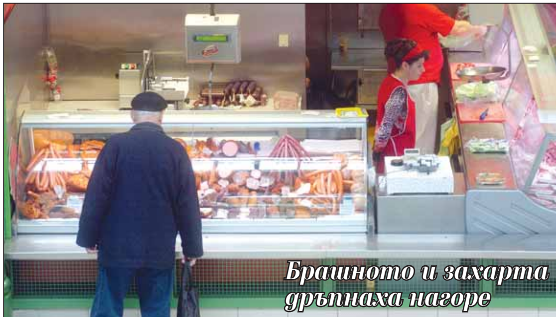
Брашното и захарта дръпнаха нагоре

та също са повишили стойностите си с по 1 стотинка на килограм, а олиото е поевтиняло с 2 ст./л.