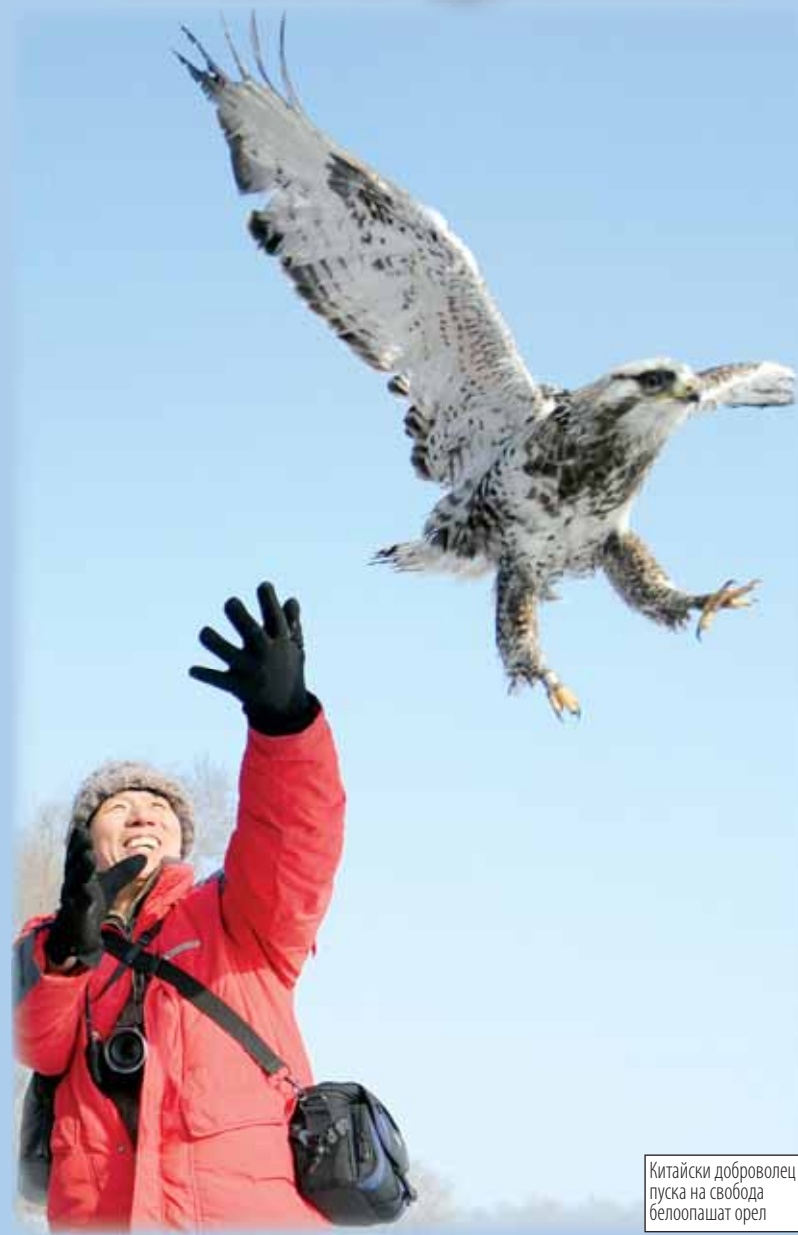
Китайски доброволец пуска на свобода белоопашат орел