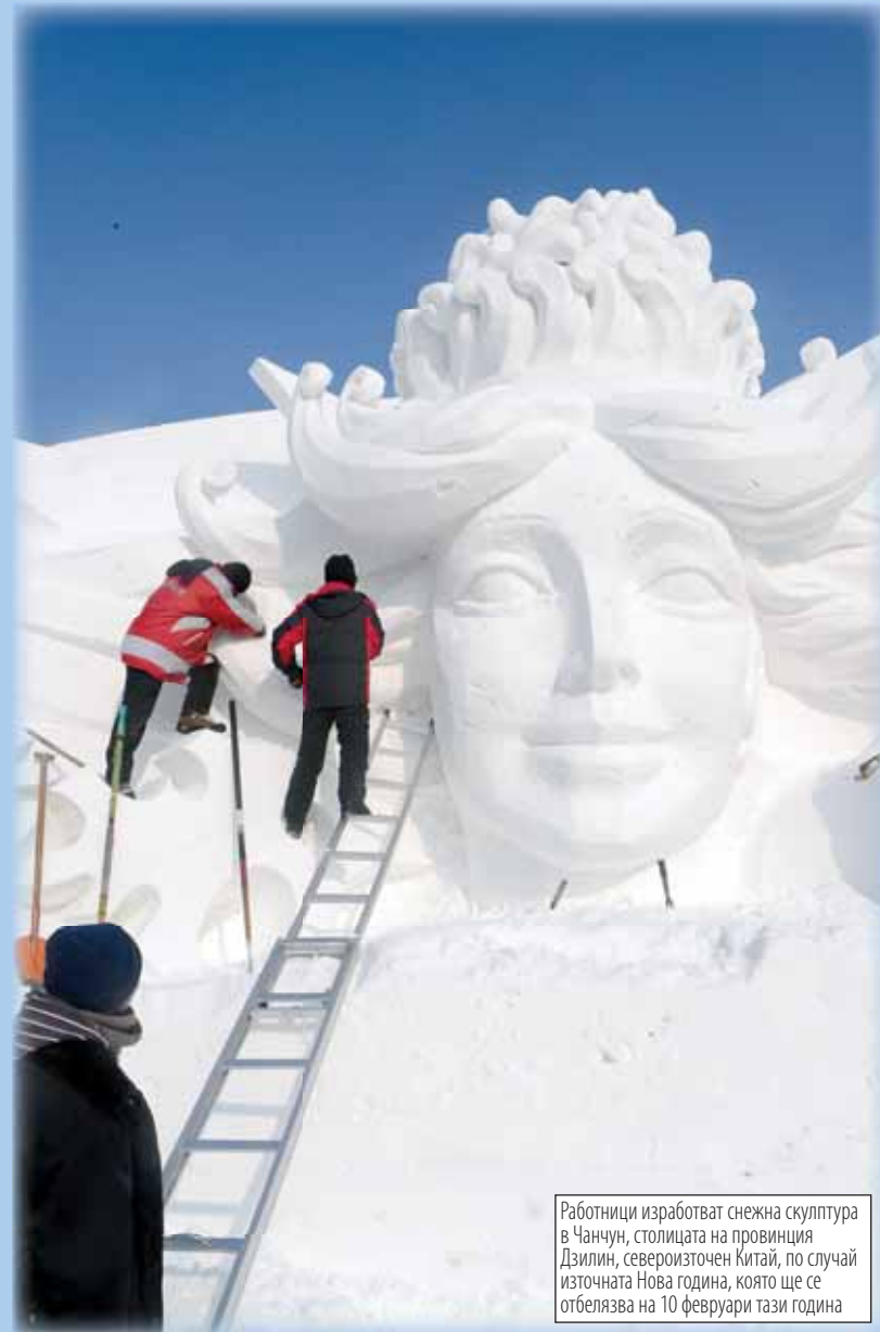
Работници изработват снежна скулптура в Чанчун, столицата на провинция Дзилин, североизточен Китай, по случай източната Нова година, която ще се отбелязва на 10 февруари тази година