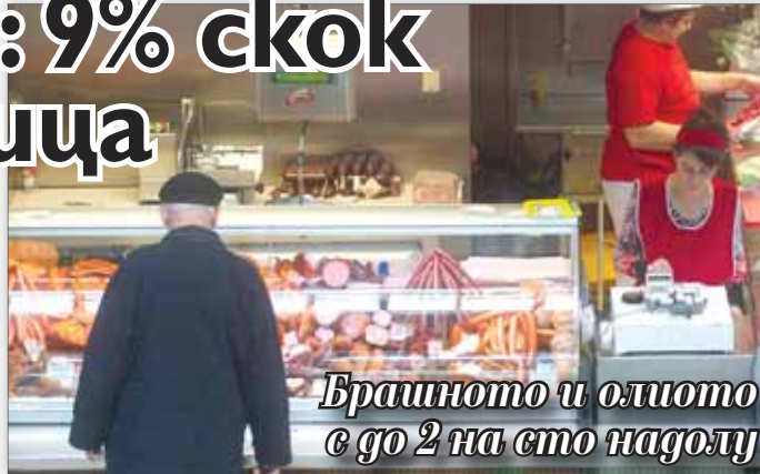
Брашното и олиото е до 2 на сто надолу

Няколко месеца преди Великден цената на агнешкото месо започна да набира сила, показва седмичният анализ на Министерство на земеделието и храните. Средното поскъпване на агнешкия бут за страната е с около 9% само за седмица, като цената на едро за килограм е достигнала почти 15 лева. Агнешкото е скочило с рекордните 27% в Благоевград, а в Русе - с 12,5%. В цялата страна то е добавило към цената си 3,9%, а агнешката плешка е скочила с 5,2%. Във Варна тя е повишила цената си с близо 50% в големите търговски вериги. Средната цена за страната е 14 лева. В София се отчита седмично поскъпване на продукта - с 0,9%.