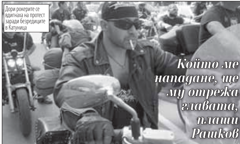
Дори рокерите се вдигнаха на протест заради безредиците в Катунница

По думите му „Цар Киро“ е заменил шофьора на буса, който прегази 19-годишния