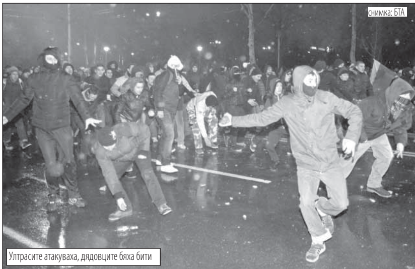
Улtrasите атакуваха, дядовците бяха бити

Напрежението по улиците в София на протеста миналата вечер ескалира. Сърцето на столицата бе заляно с кръв на мирни протестиращи възрастни хора и жени. Жестоки удари понесоха демонстрантите от полицията на кръстовището на Орлов мост.