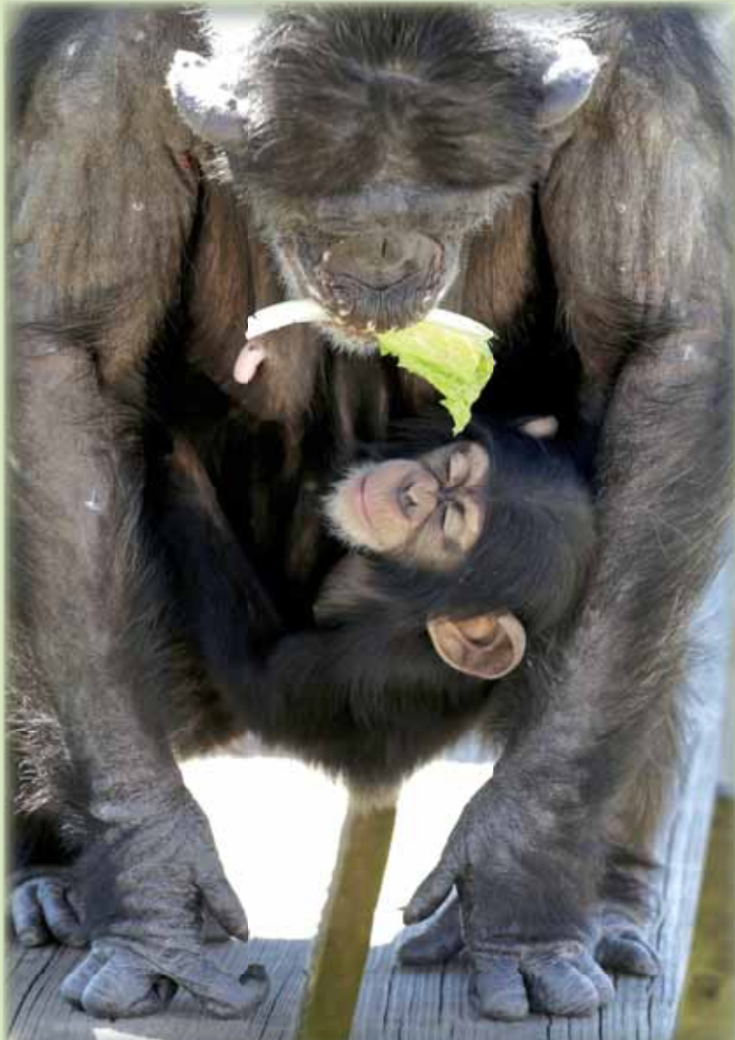
Шимпанзетата в зоопарка Чимп Хейвън в Лос Анжелис посрещнаха пролетта, похапвайки с апетит стръчката зелена салата