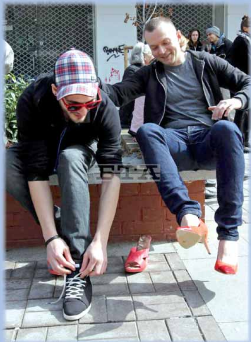
Първото българско издание на международната инициатива Извърви километър в нейните обувки се състоя в центъра на София. Организатори са Българският Червен кръст, Българският хелзински комитет и др. Още за инициативата на стр. 7