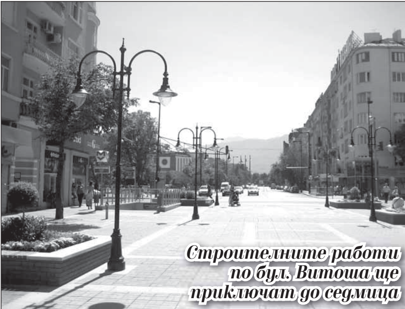
Строителните работи по бул. Витоша ще приключат до седмица