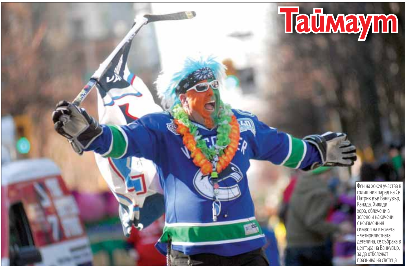
Фен на хоккея участва в годишния парад на Св. Патрик във Ванкувър, Канада. Хиляди хора, облечени в зелено и накичени с неизменния символ на късмета - четирилистната детелина, се събраха в центъра на Ванкувър, за да отбележат празника на светеца