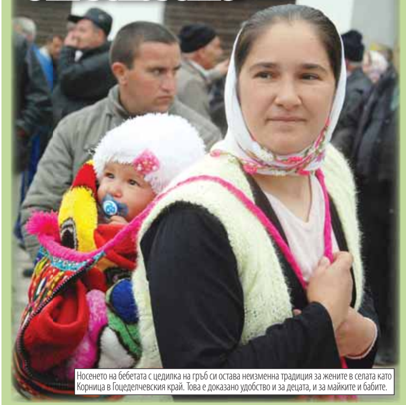
Носенето на бебетата с цеделка на гръб си остава неизменна традиция за жените в селата като Корница в Гоцеделчевския край. Това е доказано удобство и за децата, и за майките и бабите.