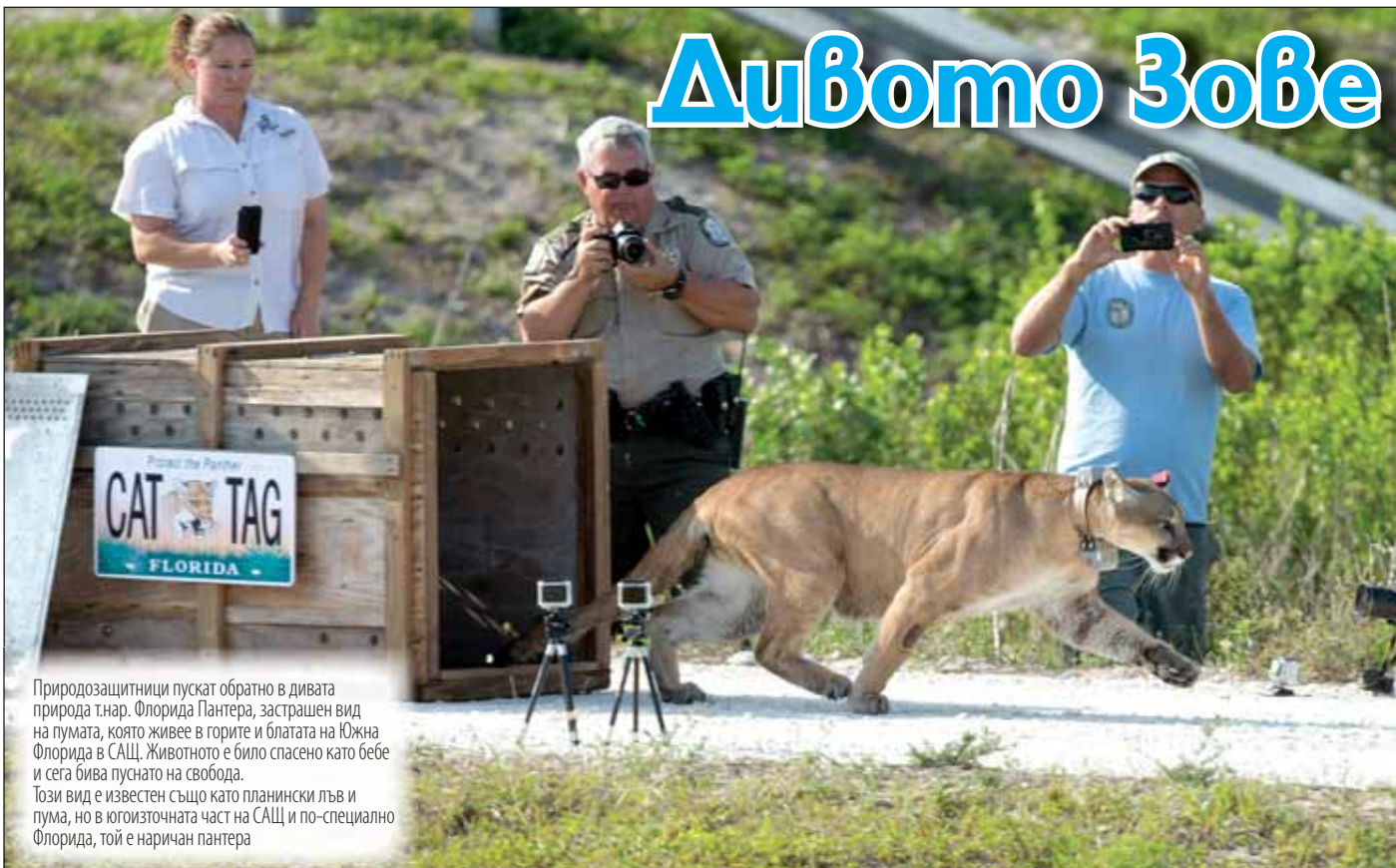
Природозащитници пускат обратно в дивата природа т.нар. Флорида Пантера, застрашен вид на пумата, която живее в горите и блатата на Южна Флорида в САЩ. Животното е било спасено като бебе и сега бива пуснато на свобода. Този вид е известен също като планински лъв и пума, но в югоизточната част на САЩ и по-специално Флорида, той е наричан пантера