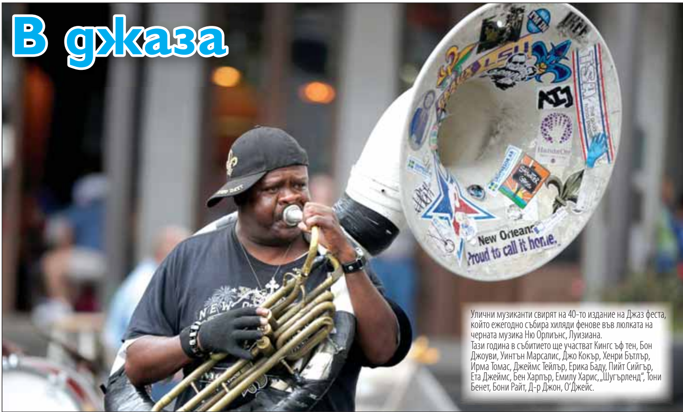
Улични музиканти свирят на 40-то издание на Джаз феста, който ежегодно събира хиляди фенове във люлката на черната музика Ню Орлиънс, Луизиана. Тази година в събитието ще участват Кингс ъф тен, Бон Джоуви, Уингън Марсалис, Джо Кокър, Хенри Бътлър, Ирма Томас, Джеймс Тейлър, Ерика Баду, Пийт Сийгър, Ета Джеймс, Бен Харпър, Емилу Харис, „Шугърленд“, Тони Бенет, Бони Райт, Д-р Джон, О'Джейс.