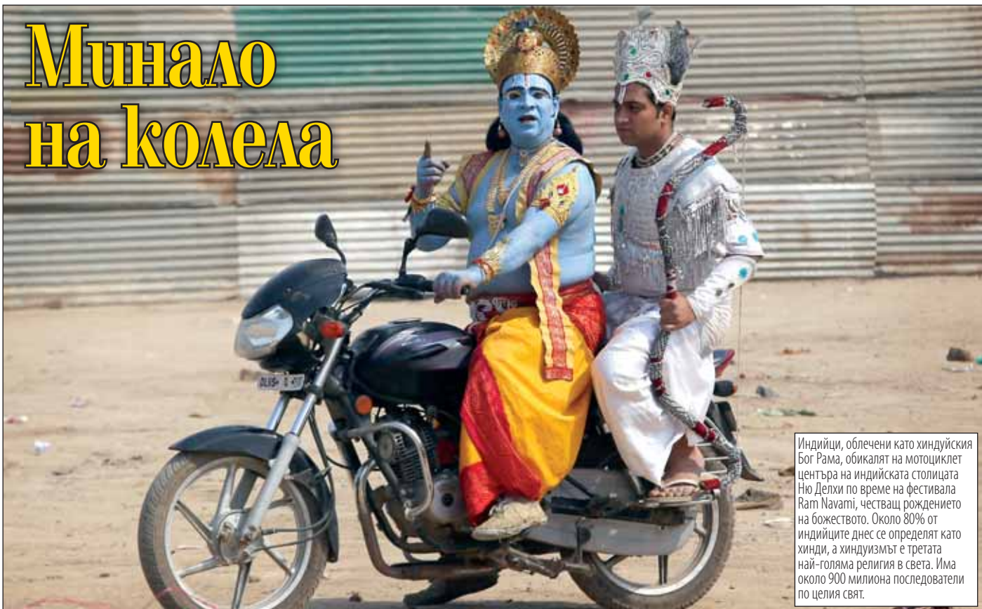
Индийци, облечени като хиндуйския Бог Рама, обикалят на мотоциклет центъра на индийската столицата Ню Делхи по време на фестивала Ram Navami, честваш рождението на божеството. Около 80% от индийците днес се определят като хинди, а хиндуизмът е третата най-голяма религия в света. Има около 900 милиона последователи по целия свят.