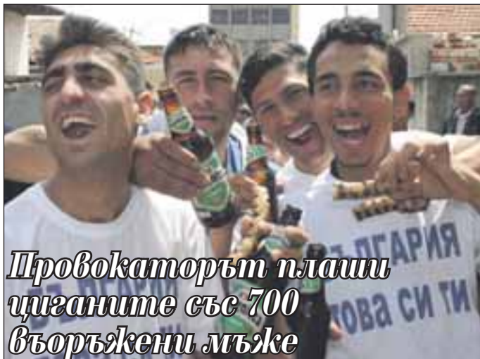
Провокаторът плаши циганите със 700 въоръжени мъже

22-годишен мъж е уличен в провокаторска дейност, подстрекаваща към бунт ромеко-