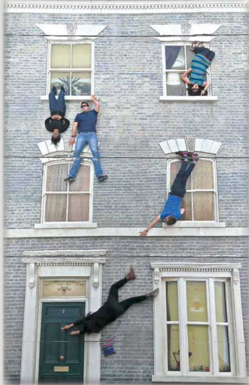
Посетителите се радват на арт инсталацията на художника Леандро Ерлих. Международно известен със своите пленителни и триизмерни визуални илюзии, той е изрисувал улицата с 3D викторианска терасовидна къща.