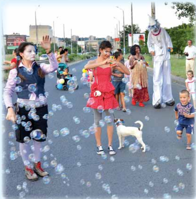
Най-дългият градски мост в страната, който се намира в Кърджали бе превърнат в алея на забавленията. Събитието е част от европейския проект Мостът – кръстопът на култури, спечелен от община Кърджали.