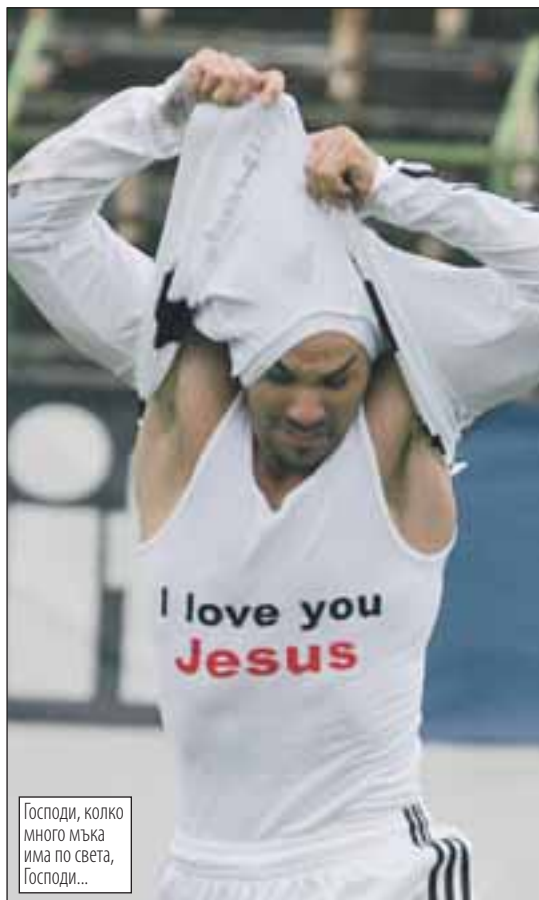
Господи, колко много мъка има по света, Господи...