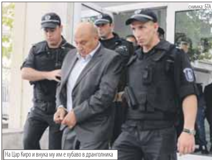
На Цар Киро и внука му им е хубаво в драгголика