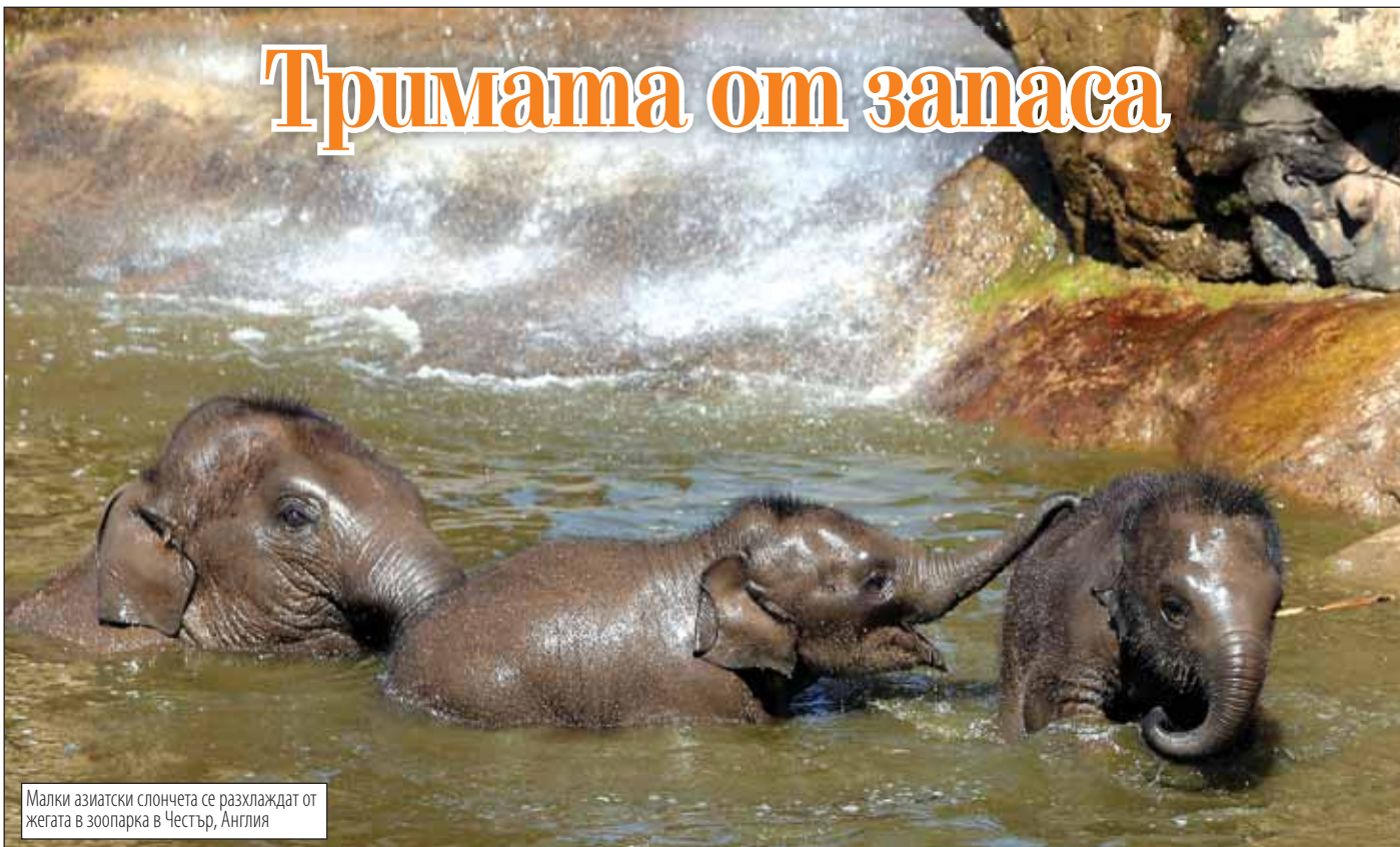
Малки азиатски слончета се разхлаждат от жегата в зоопарка в Честър, Англия