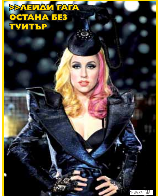
»ЛЕЙДИ ГАГА ОСТАНА БЕЗ ТУИТЪР