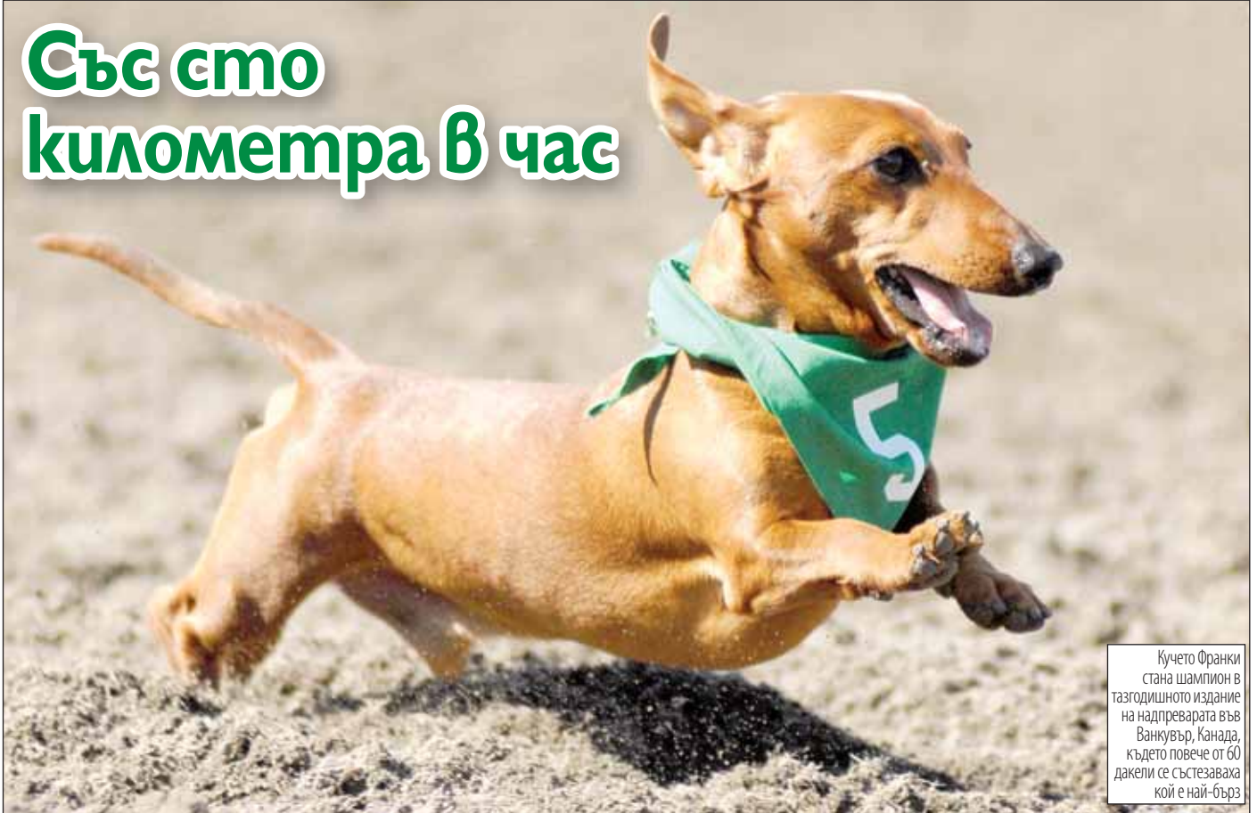
Кучето Франки стана шампион в тазгодишното издание на надпреварата във Ванкувър, Канада, където повече от 60 дакели се състезаваха кой е най-бърз