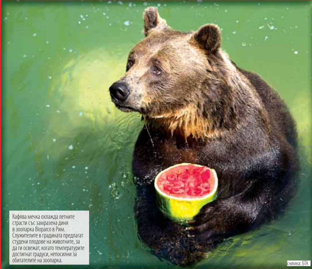
Кафява мечка охлажда летните страсти със замразена диня в зоопарка Виорасо в Рим. Служителите в градината предлагат студени плодове на животните, за да ги освежат, когато температурите достигнат градуси, непосилни за обитателите на зоопарка.