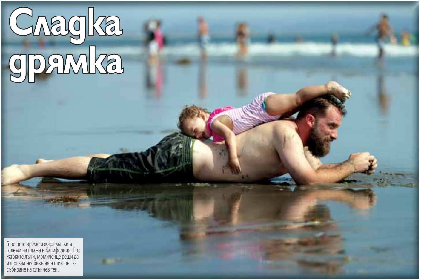
Горещото време изкара малки и големи на плажа в Калифорния. Под жарките лъчи, момиченце реши да използва необикновен шезлонг за събиране на слънчев тен.