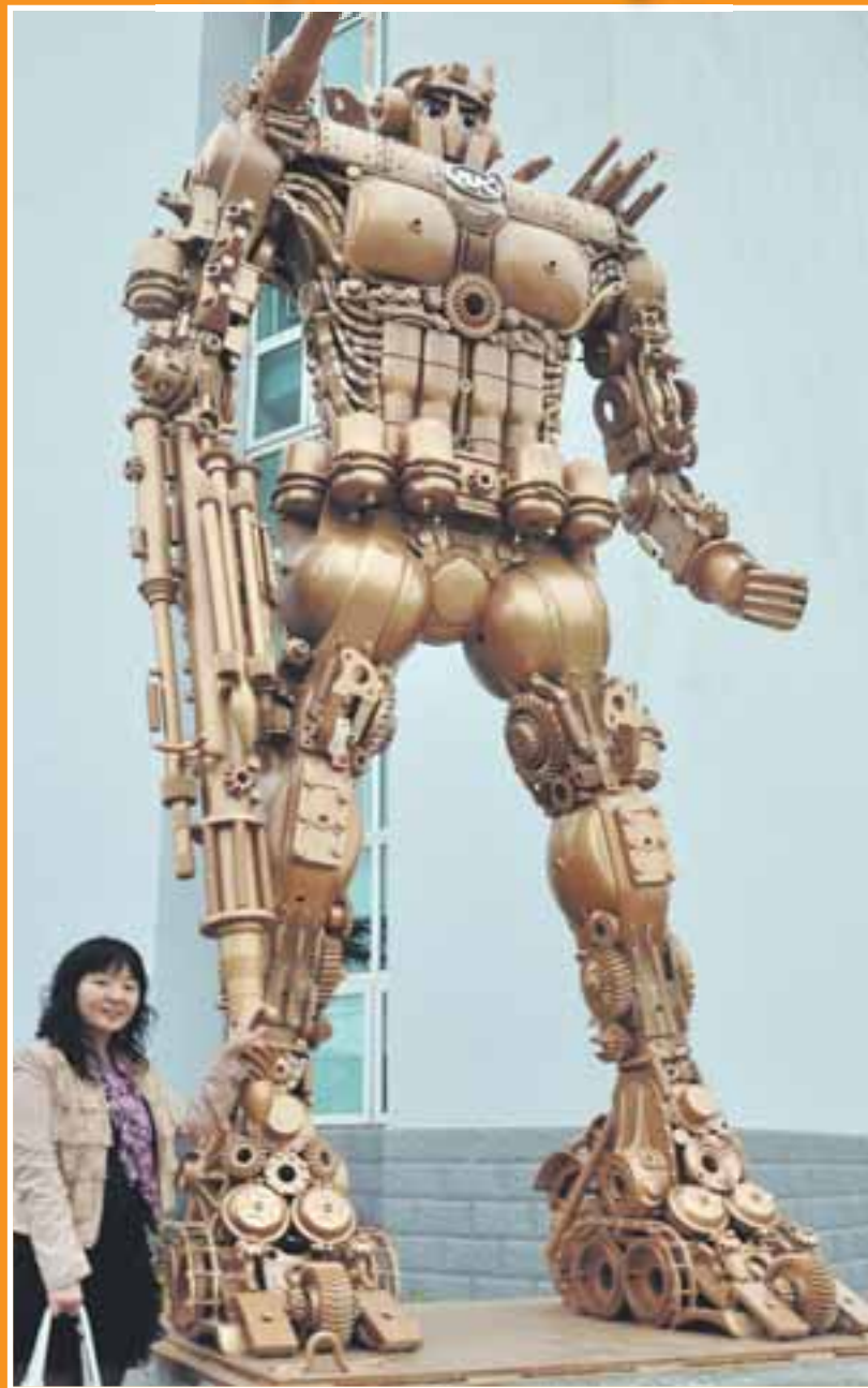
Китайка позира за снимка в подножието на 4,58-метровия модел на легендарния Оптимус Прайм от филма „Трансформърс“ в Хефей (Кит). Исполинът, достоен за романа на Айзък Азимов Аз, роботът, тежи 4 тона и е направен от над 1000 рециклирани компонента